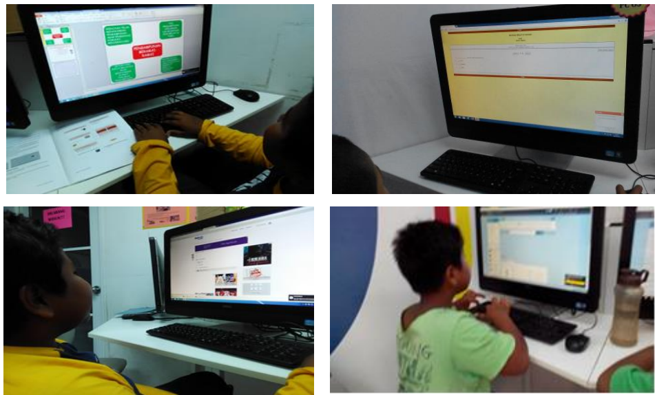
Caption : Muhd Hazwan Haziq mengulang-kaji pelajaran di PI1M secara talian dan manual .