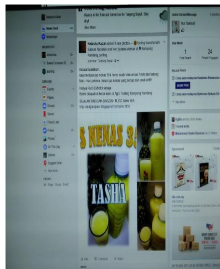
Caption : Blog : http://redgiantpine.blogspot.my