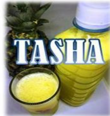
Caption :Produk minuman jus nenas yang dijual oleh Cik Natasha